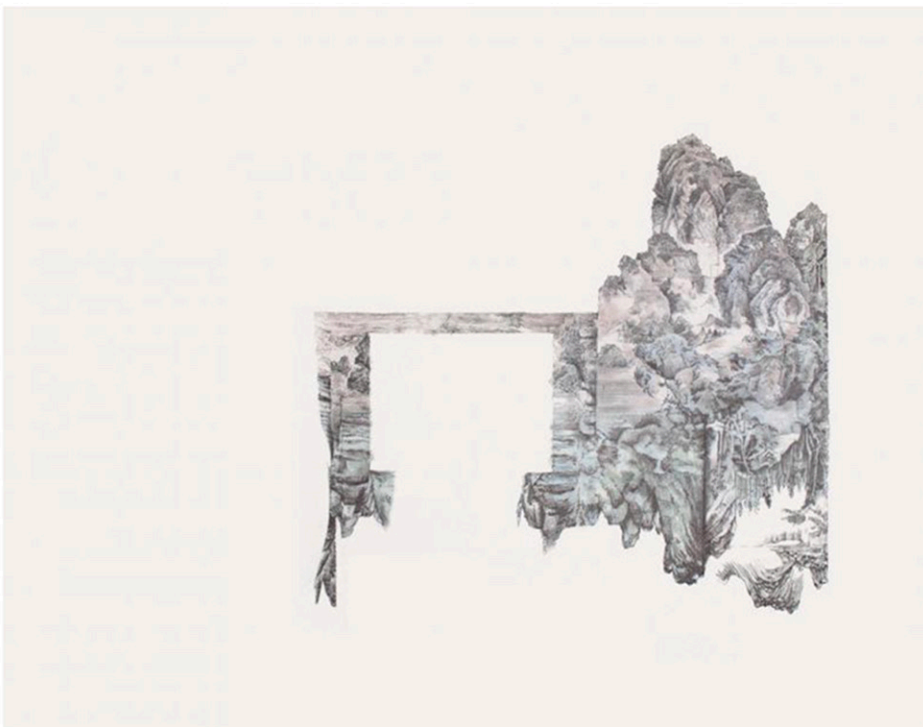
Bunkaru stage, 2022 30 x 40 cm ombres à paupières, encres, et poudre de graphite sur papier © Héliène Muheim, Courtesy Galerie Valérie Delaunay