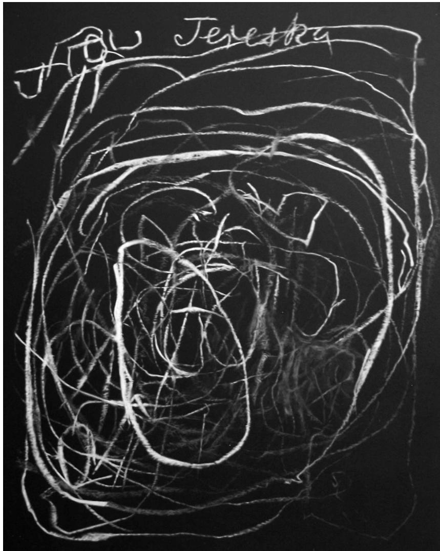
Matthieu Boucherit / The home of Tereska, 2016, acrylique sur toile, 116 X 89 cm.