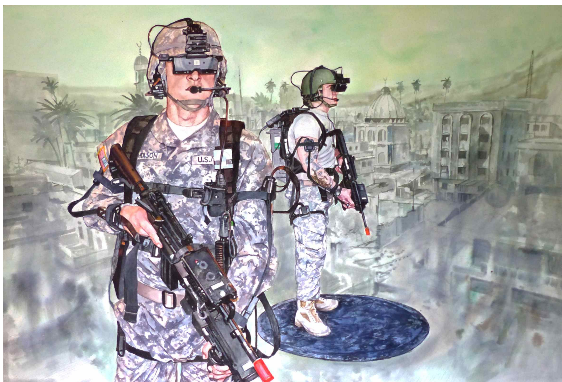
Alain Josseau / War Games 4, 2016, aquarelle et encre aquarelle sur papier Arche, 96 x 136 cm.