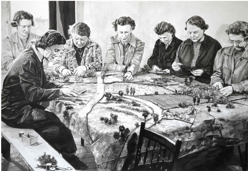
Alain Josseau / Géographe n° 35, 2013, aquarelle sur papier, 77 x 107 cm.