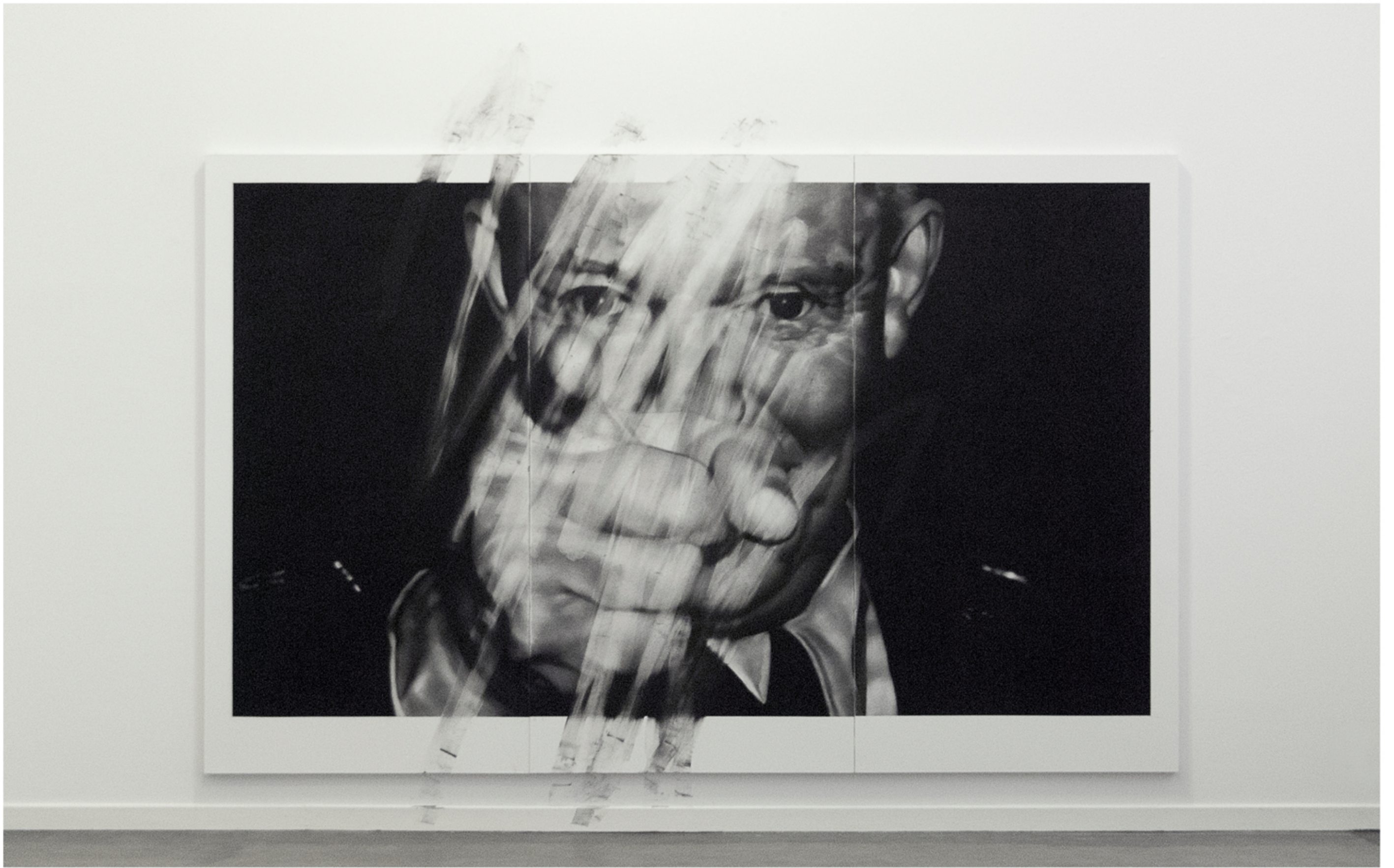
Remember. 2016. Fusain et pierre noire. 350 x 220 cm