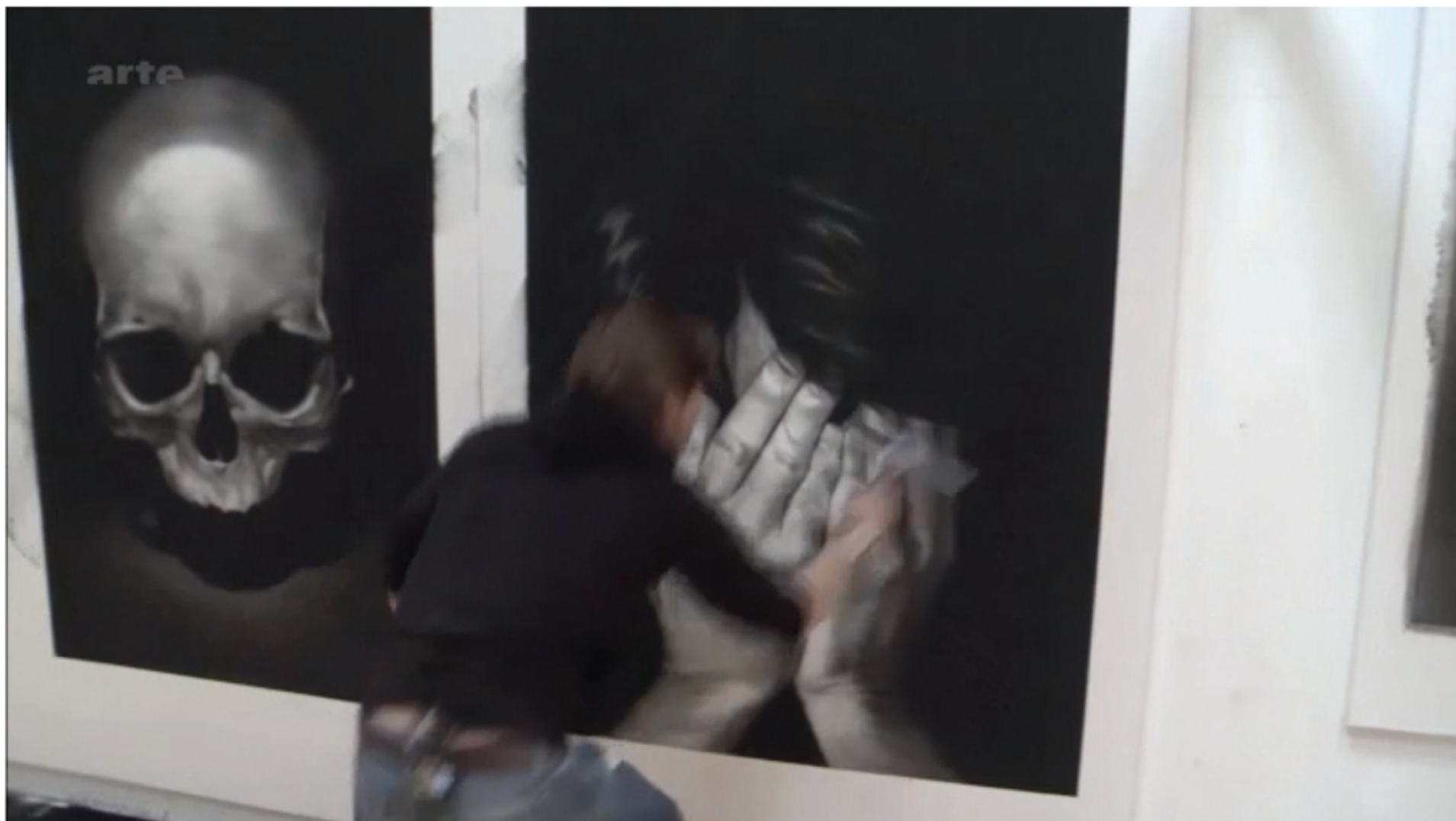
2013. Effacement de « Welcome to our paradise » Extrait de « Draw Different » pour l'émission TRACKS d'Arte.