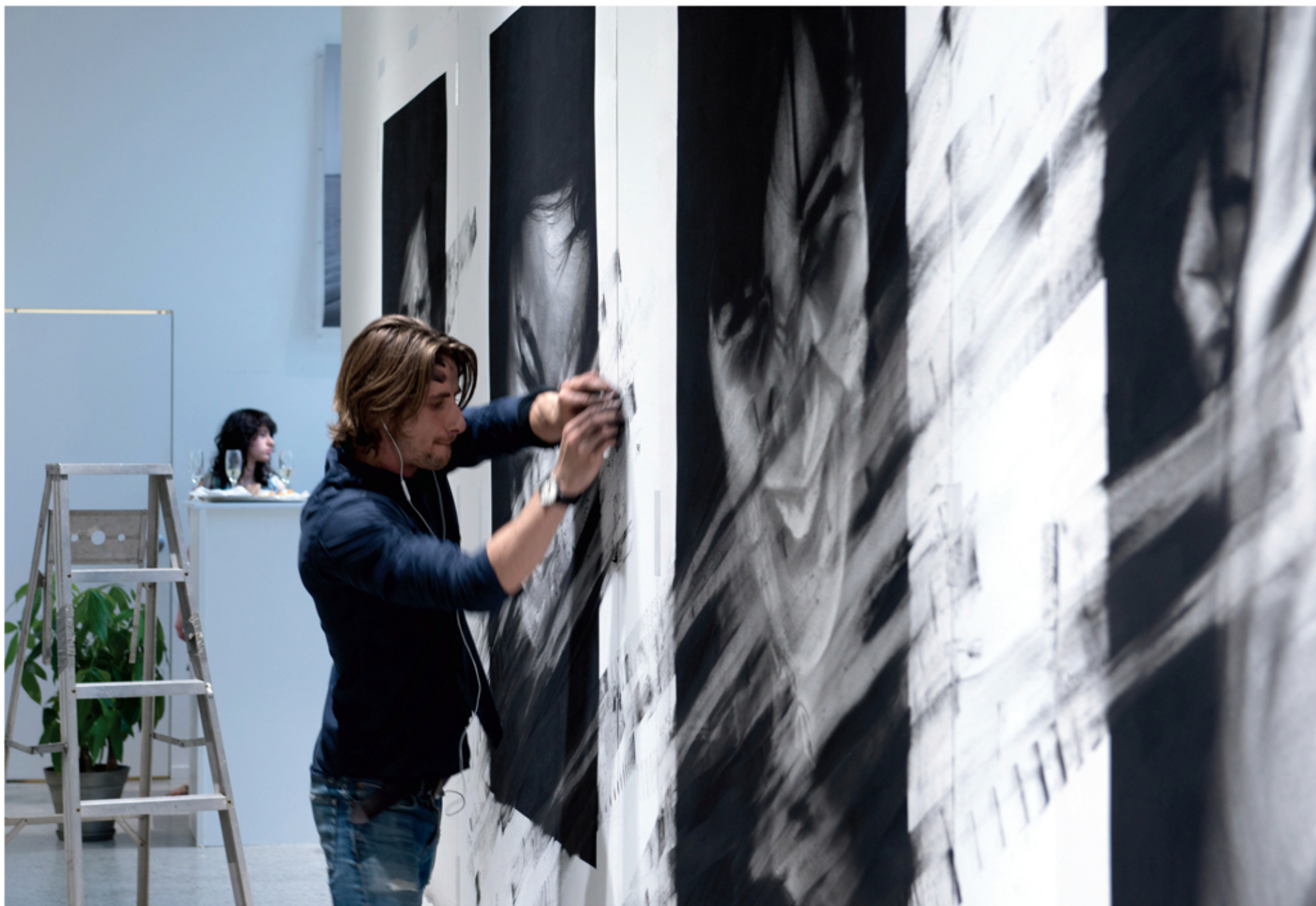
2014. Performance d'effacement lors du vernissage de l'exposition « Scène Parisienne » à la Galerie Samuel Lallouz, Montréal, Canada.