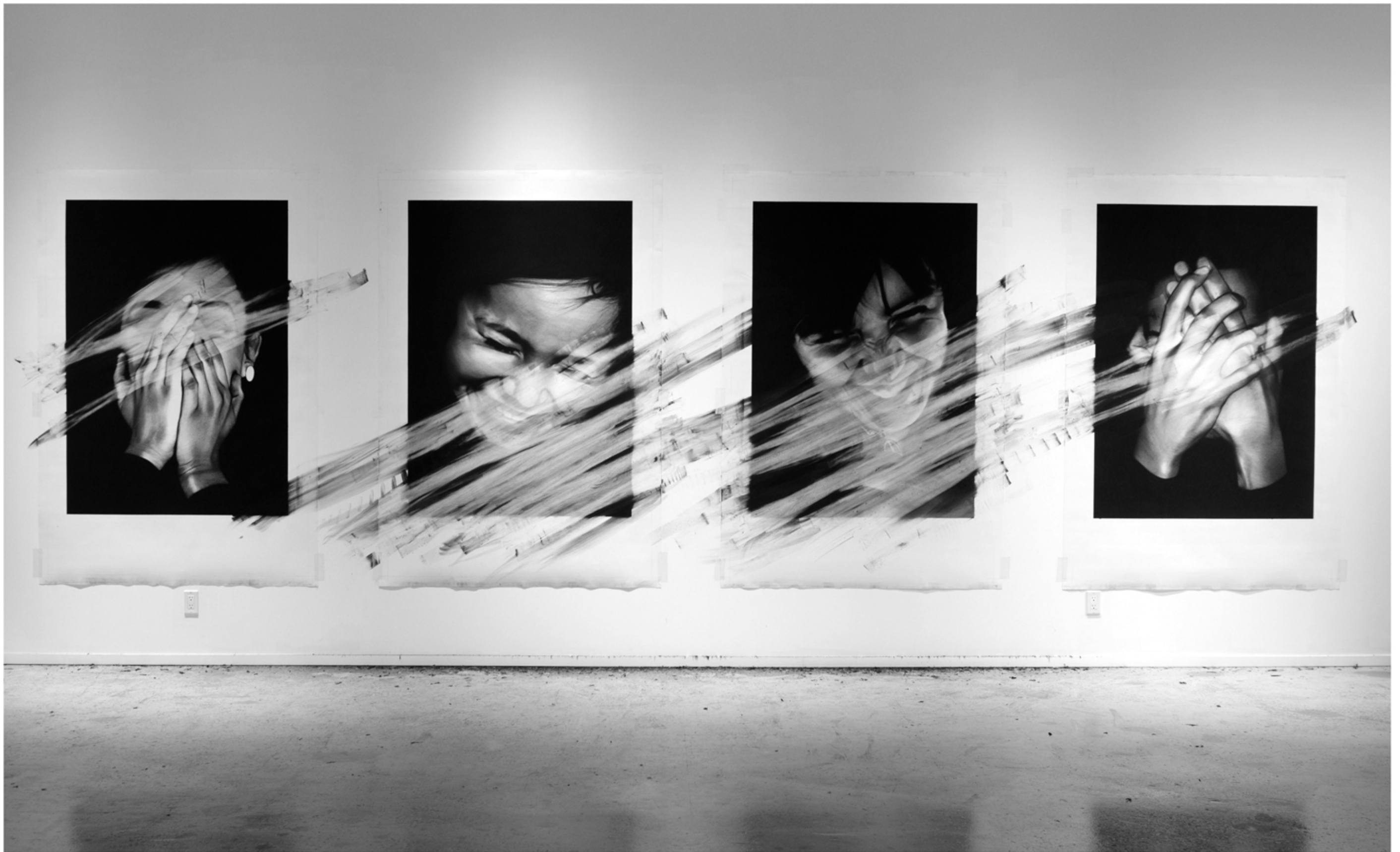
autoportrait. 2014. Fusain et pierre noire. 195 x 580 cm