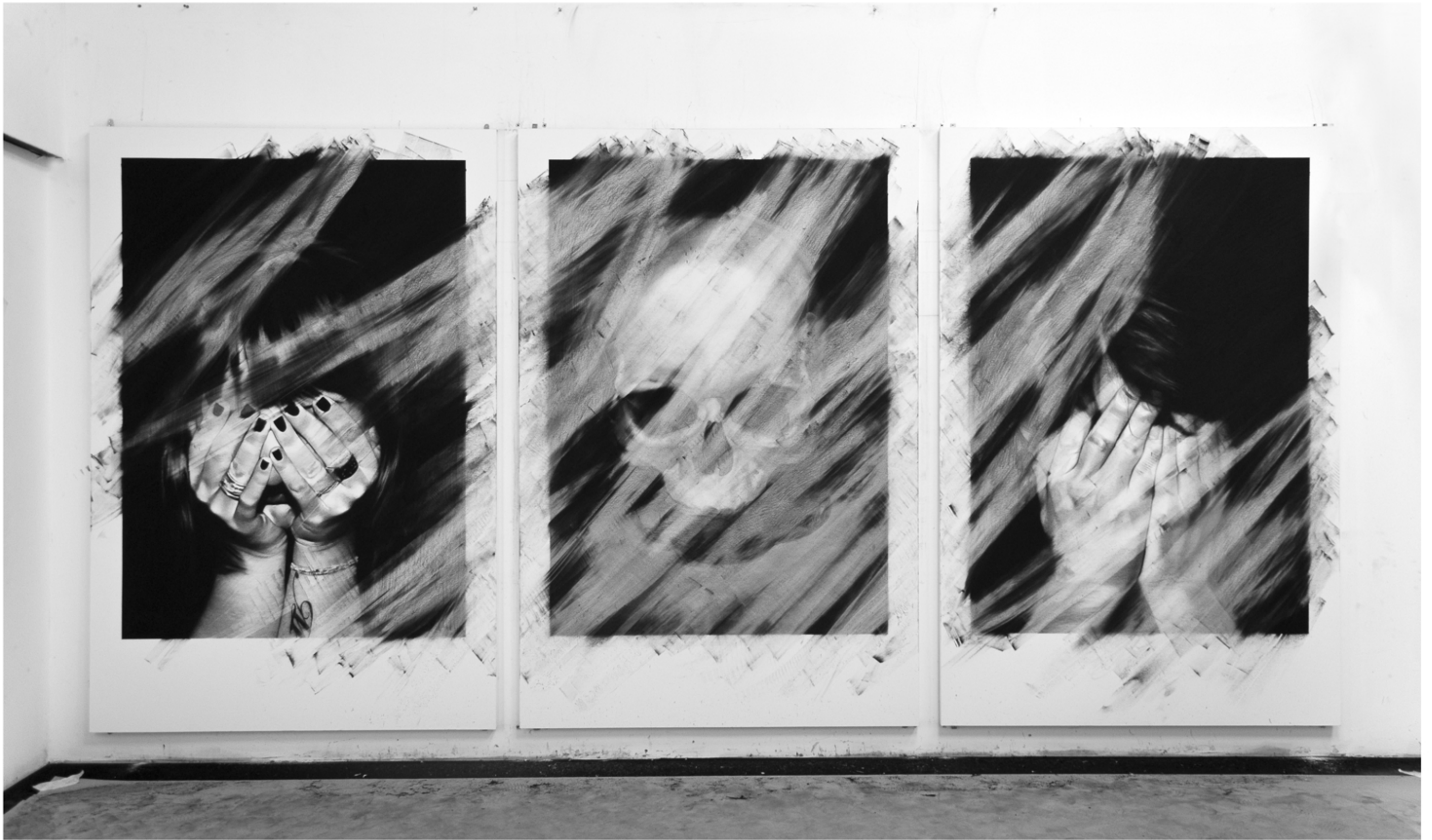
Welcome to our paradise. 2013. Fusain et pierre noire. 390 x 195 cm (3 panneaux de 130 x 195 cm)