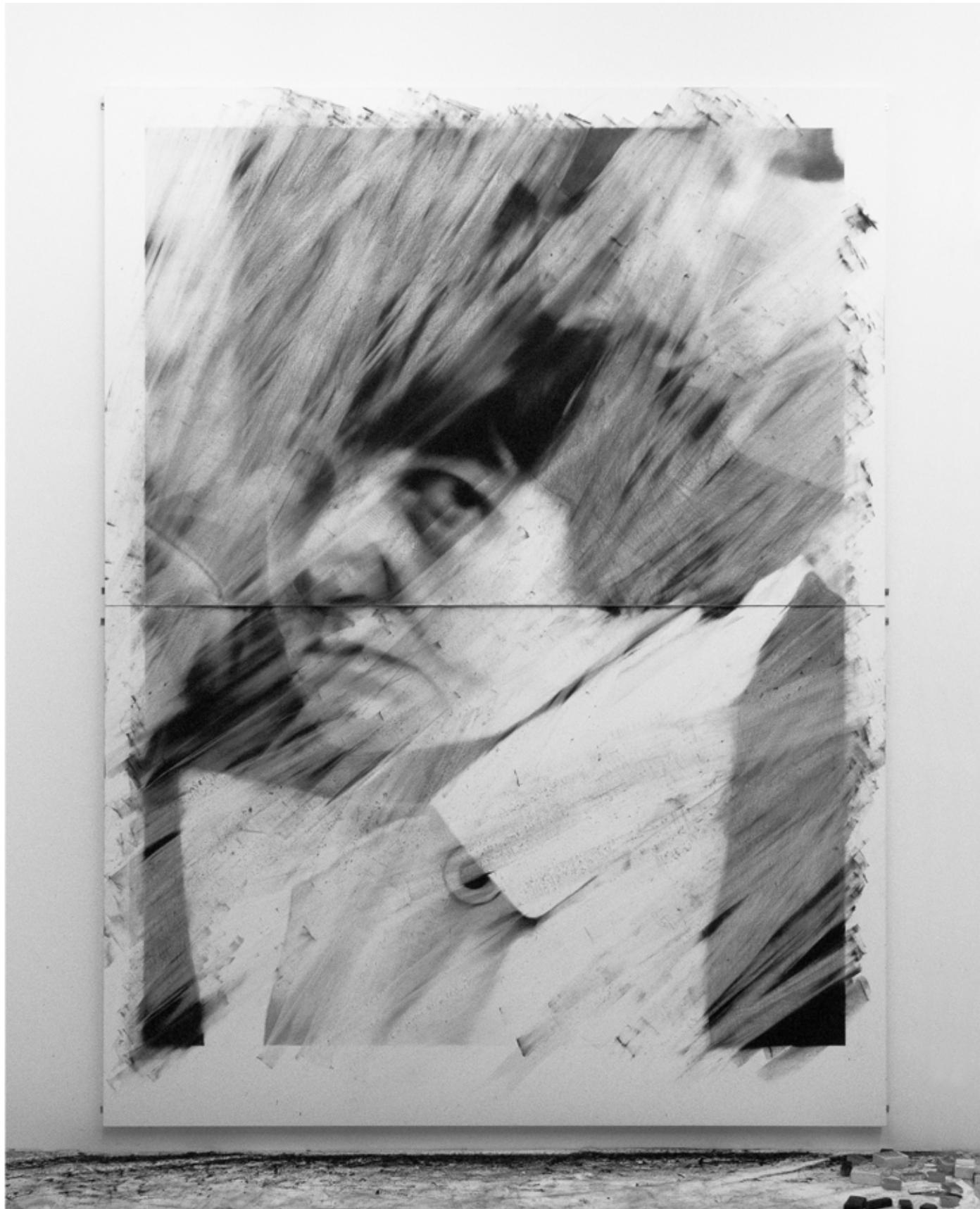
Rosemary 03. 2012. Fusain et pierre noire sur papier. 195 x 260 cm Dessin effacé dans le cadre de « Rosemary project » lors de Nuit Blanche Paris 2012