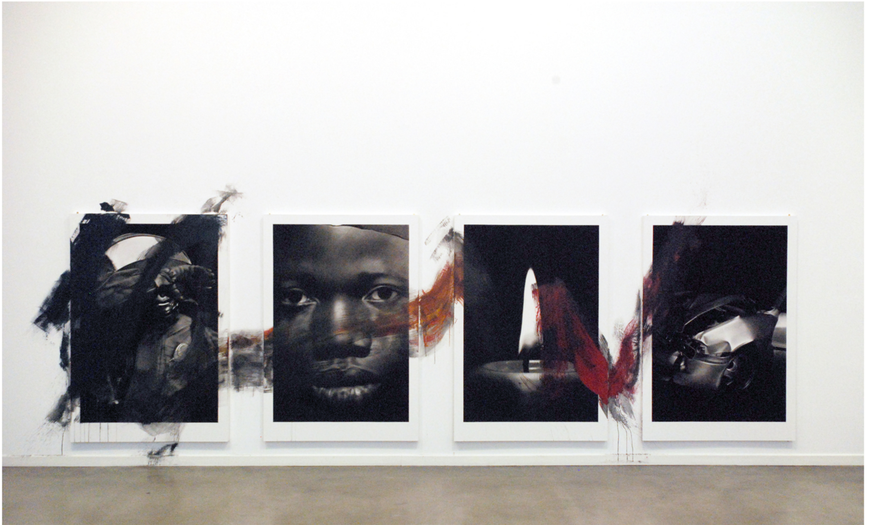
Member. 2016. Fusain, pierre noire et acrylic. 610 x 195 cm (130 x195 cm chacun)