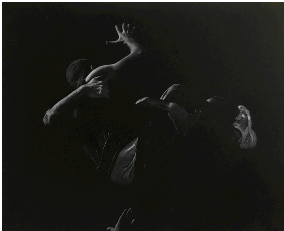
Série Théâtres, «ct3twjqau4wopphxpzfx », acrylique sur toile, 130 x 162 cm, 2017