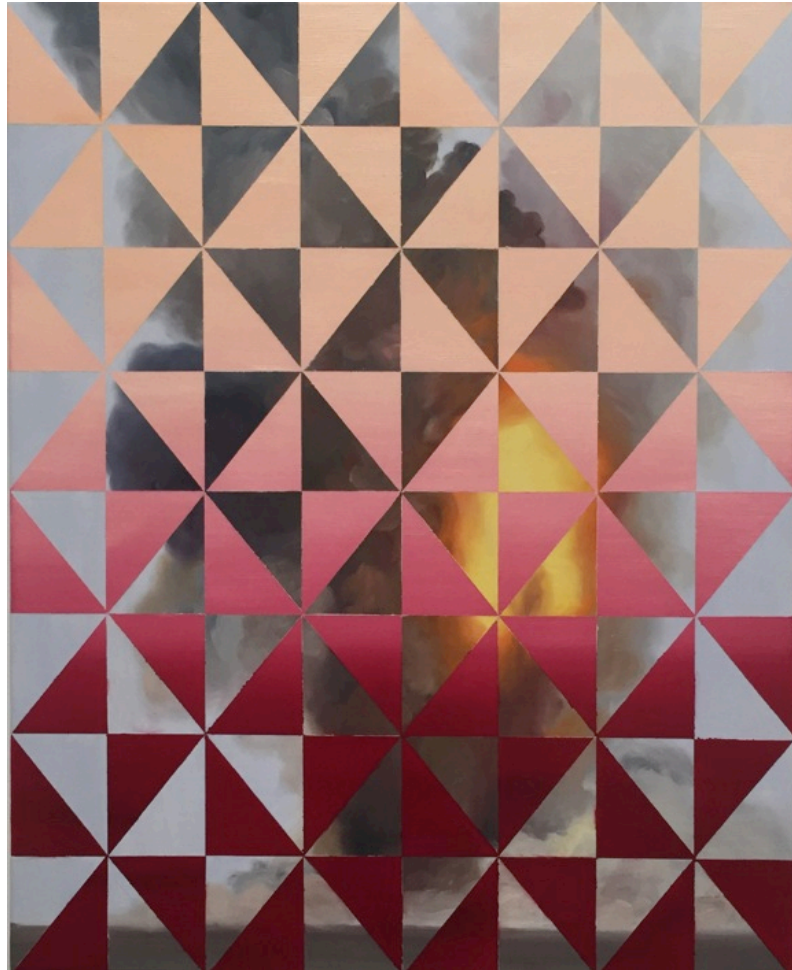
Troisième souffle, huile sur toile, 65 x 81 cm, 2017