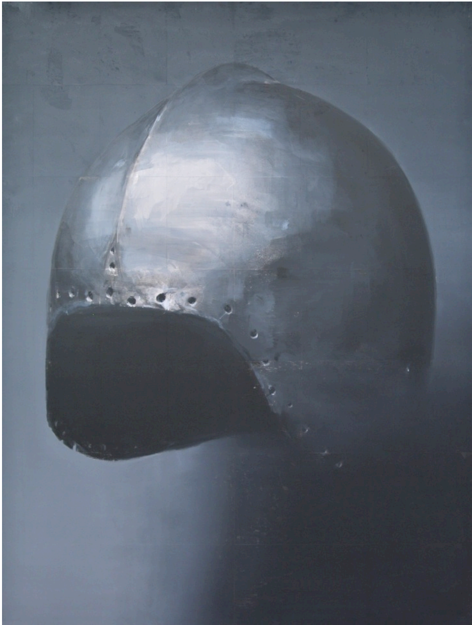
Sans titre - 2016 - Huile sur toile - 140 x 100 cm