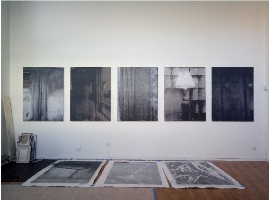
Vue de l'atelier