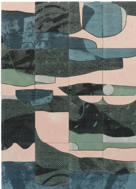
Yoan Béliard, Lagune, 2023, plâtre/fibres, pigments, toner et acier, 112 x 80 cm