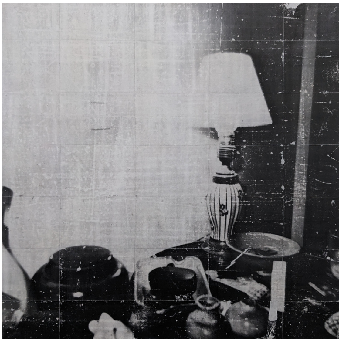
Timothée Schelstraete, 220502, 2022, toner, acrylique et aérosol sur toile, 130 x 130 cm