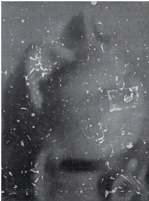
Timothée Schlestraete, TS211213, 2021, toner, acrylique et aérosol sur toile, 24 x 18 cm