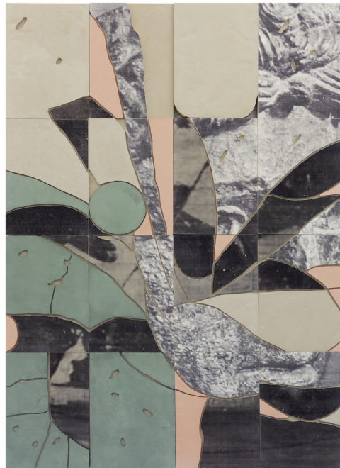
Yoan Béliard, Témoin, 2023, plâtre/fibres, pigments, toner et acier, 112 x 80 cm