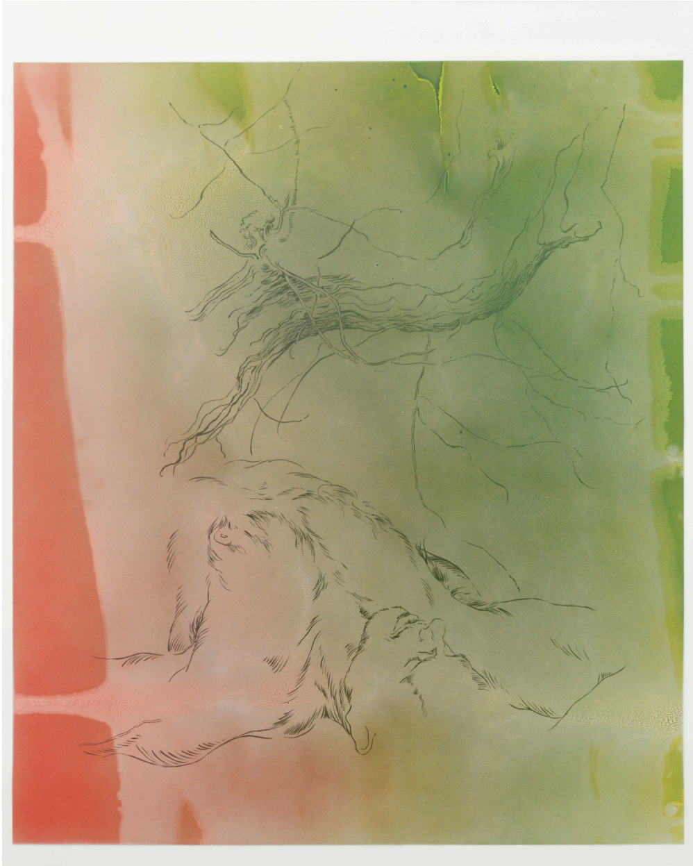
Sans titre , 2024, techniques mixtes sur PVC, 120 x 150 cm