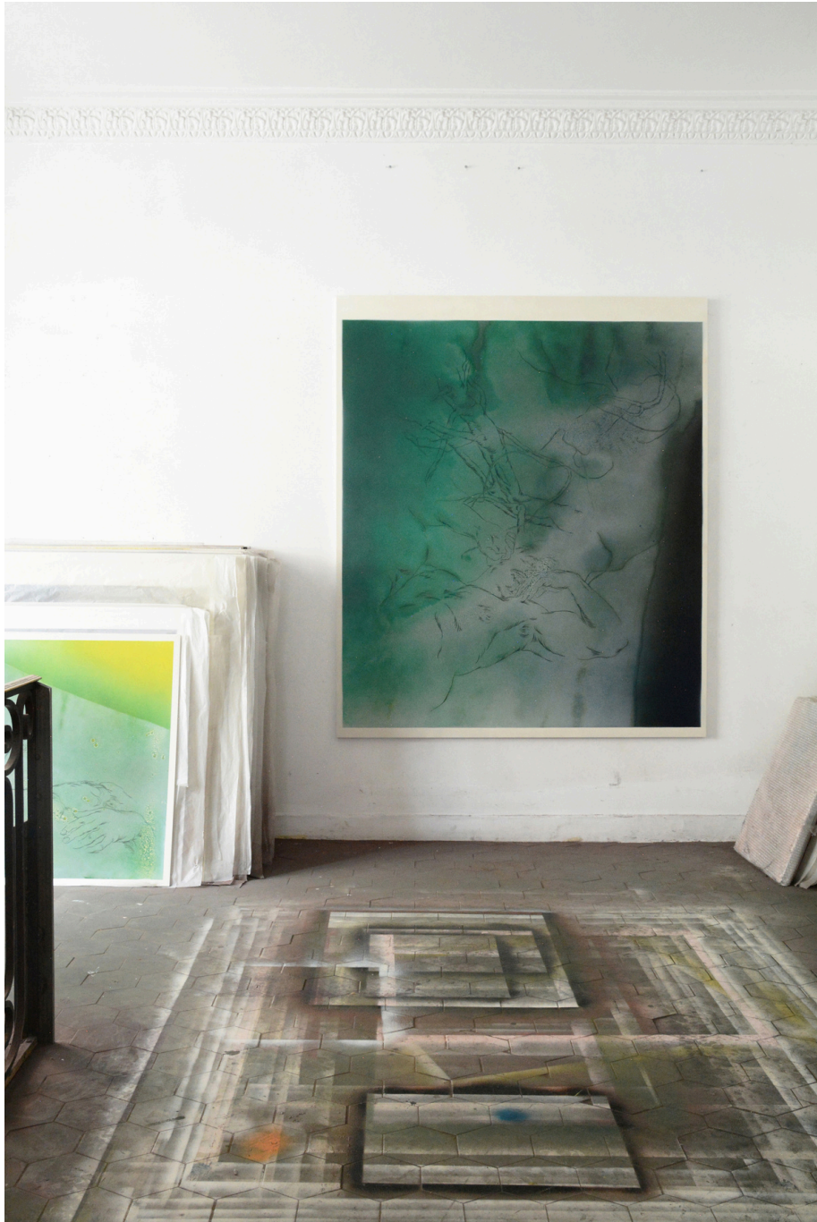
Vue de l'atelier de Sylvain Polony