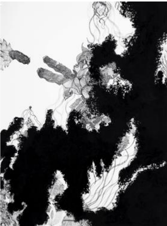
Sans titre - Encre de chine et barre à l'huile sur papier – 105 x 75 cm – 2013

15 square Edouard VII, 75009 Paris > + 33 (0) 6 63 79 93 34 > contact@valeriedelaunay.com