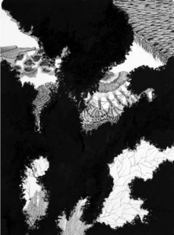
Sans titre - Encre de chine et barre à l'huile sur papier – 105 x 75 cm – 2013