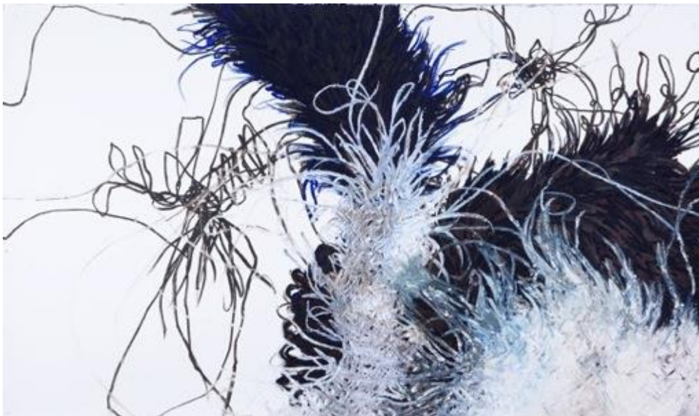
Sans titre - Barre à l'huile sur papier Arches – 124 x 200 cm – 2014