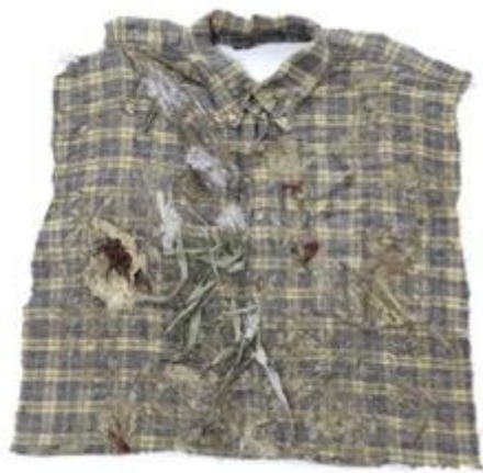
Chemise II – Textile, technique mixte et photographie – 52 x 40 cm – 2013