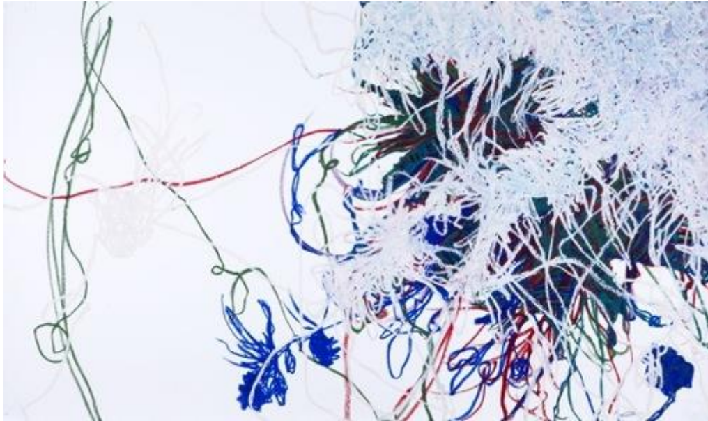
Sans titre - Barre à l'huile sur papier Arches – 124 x 200 cm - 2014