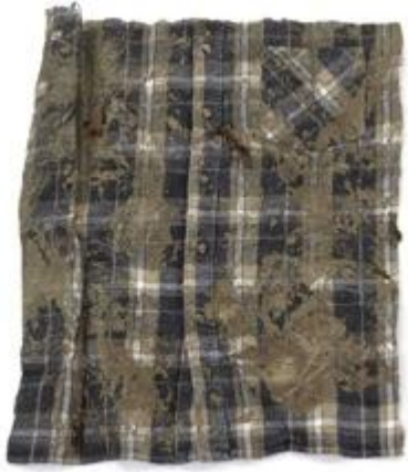
Chemise I – Textile, technique mixte et photographie – 52 x 40 cm – 2013