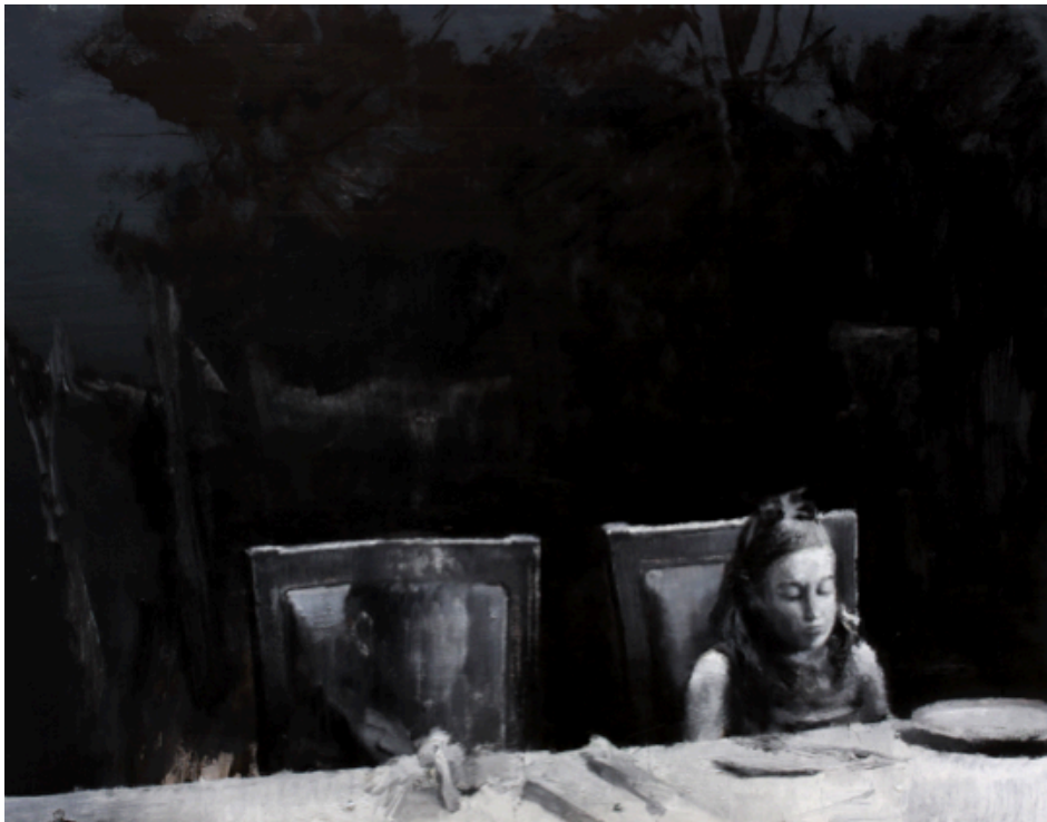
Julien Spianti, The dinner, Huile sur papier, 65 x 50 cm - 2014