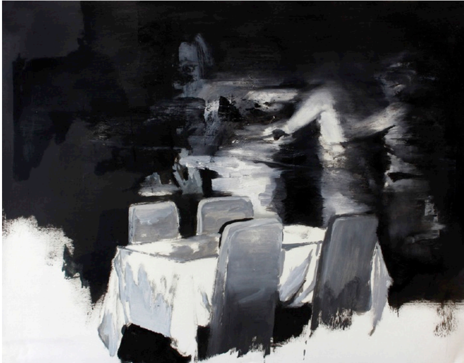
Ronde, Huile sur papier, 65 x 50 cm - 2014