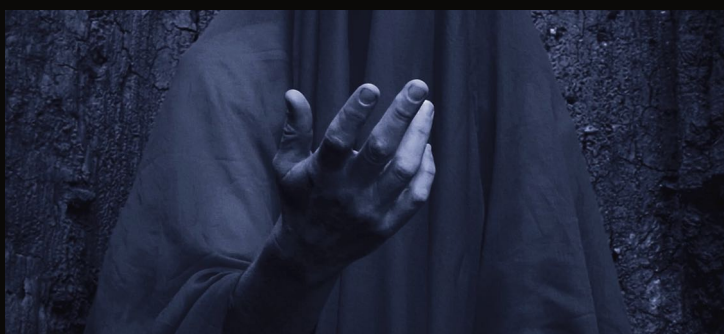
Sofie DIEU, Ara, Made of Stardust , 2023, vidéo, 04'47" © Sofie Dieu