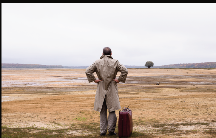
Pascal SENTENAC, Léger égarement 1 , 2023, photographie, 70 x 100 cm