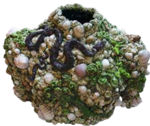
Gisèle Garric, Grand buste , 2025

Conversant avec la Tempête de Pauline Bazignan inspiré du chef d'oeuvre de Giorgone, l'un des tableaux les plus énigmatiques de l'histoire de l'art, le Grand buste de Gisèle Garric, fait vivre la mémoire de Bernard Palissy qui avait intégré le goût des grottes importé d'Italie dans ses céramiques.