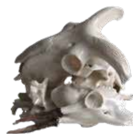
François Chaillou, Nature morte , 2025