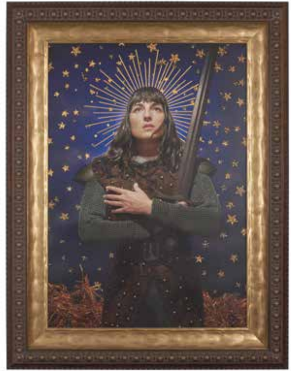
Pierre & Gilles, Jeanne la rebelle, Juliette Armanet, 2019