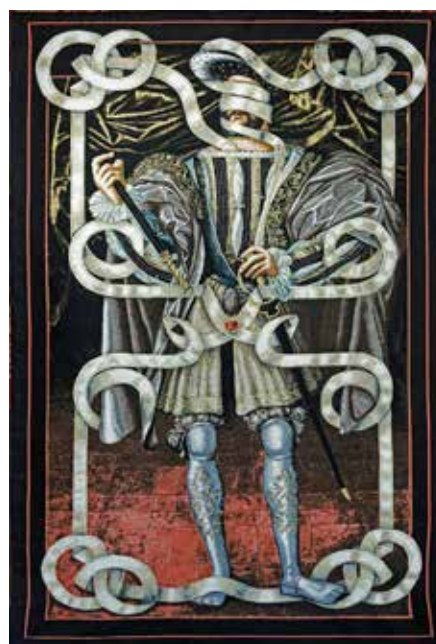
Volker Hermes.

- Le miroir, avec l'œuvre de Jean-Baptiste Caron , le visiteur, en effleurant de son souffle un miroir, verra apparaître une phrase-rêve avant de la voir disparaître aussitôt.