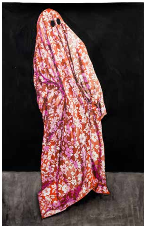
Gilles Barbier, Hawaian ghost , 2019 Gouache sur papier, 158 cm x 105 cm Collection Château du Rivau