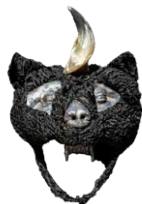
Angélique de Chabot, Ours noir , 2025