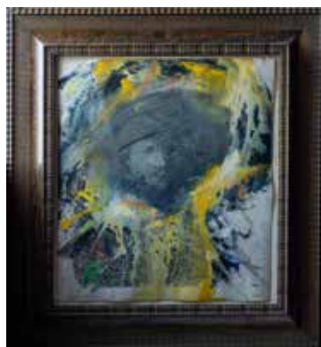
Arnulf Rainer, Rembrandt

En 2026, découvrir l'Histoire de l'Art autrement au milieu de la collection et de l'exposition Métamorphoses au Rivau . Entre humour et émerveillement, sortez des sentiers battus de l'histoire de l'art, en souriant tout en vous étonnant. Une expérience joyeuse et originale à partager en famille ou entre amis avec nos médiatrices, nos livres jeux et notre quiz !