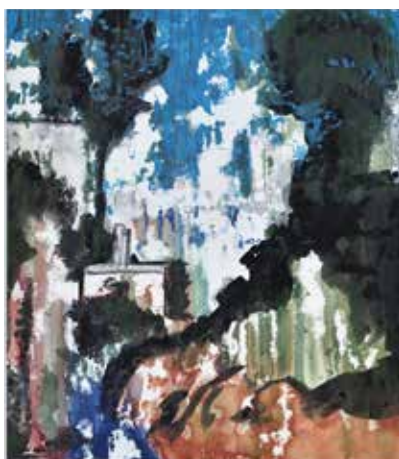
Pauline Bazignan, la tempête , 2025

Le cabinet de curiosités ou studiolo était le lieu où le seigneur des lieux conservait des objets précieux rapportés des lointains voyages et des curiosités destinés à stimuler l'imaginaire. De nos jours, un des plaisirs de l'art contemporain est de décrypter le sens de l'œuvre et prolonger ainsi l'esprit de curiosités. Au Rivau, nous perpétons cette attitude en intégrant des œuvres d'art de notre époque, dans le registre de la curiosité et quelquefois de l'inattendu.