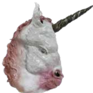
Margaux Laurens Neel, Licorne , 2025