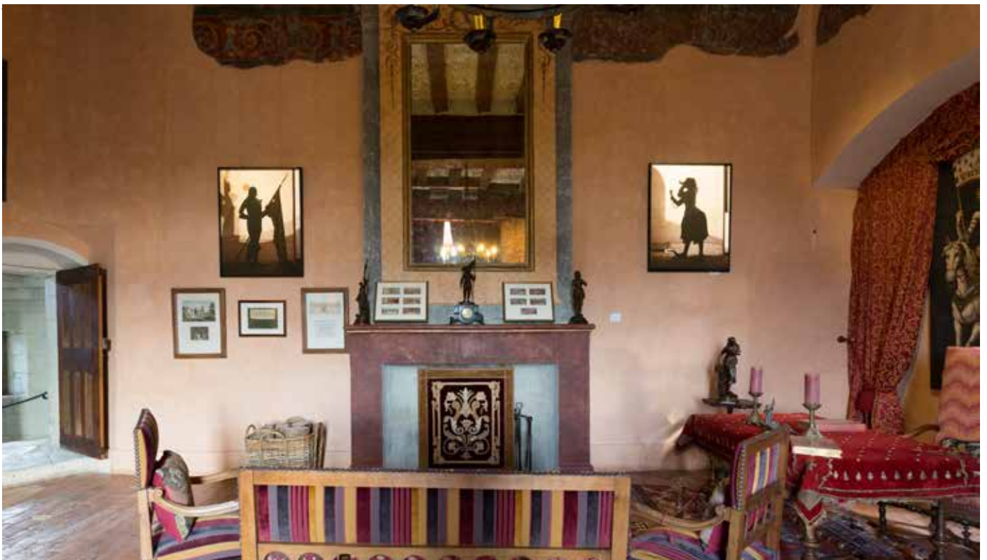
Charles Freger, Jeanne au fanion & Jeanne auréolée, 2016