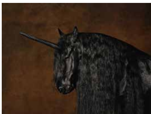
MC. Thijs. Black unicorn, 2013