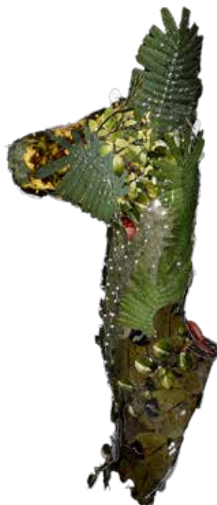
Magali Lambert, Tête de chevreuil , 2025

Le ' Salvator Mundi ' (Sauveur du Monde) créé par l'artiste belge Jan Fabre, une sphère surmontée d'une épine dorsale proche des globus cruciger de la tradition chrétienne, est aussi dans cette veine.