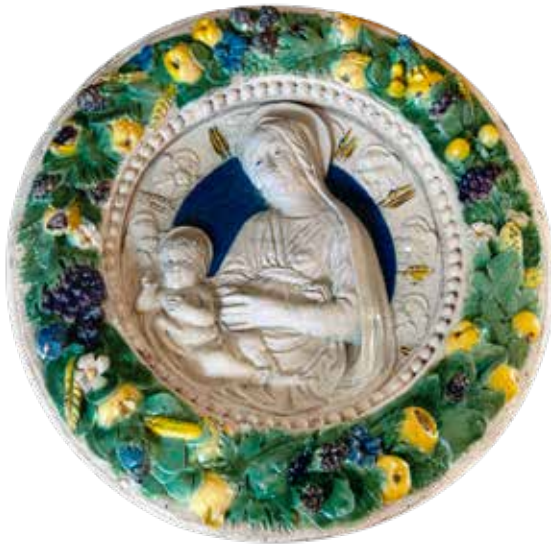
Giovanni Della Robbia, Vierge à l'enfant, 1534