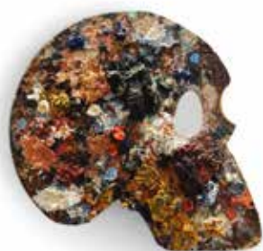
Céline Cléron, Masque singulier , 2025