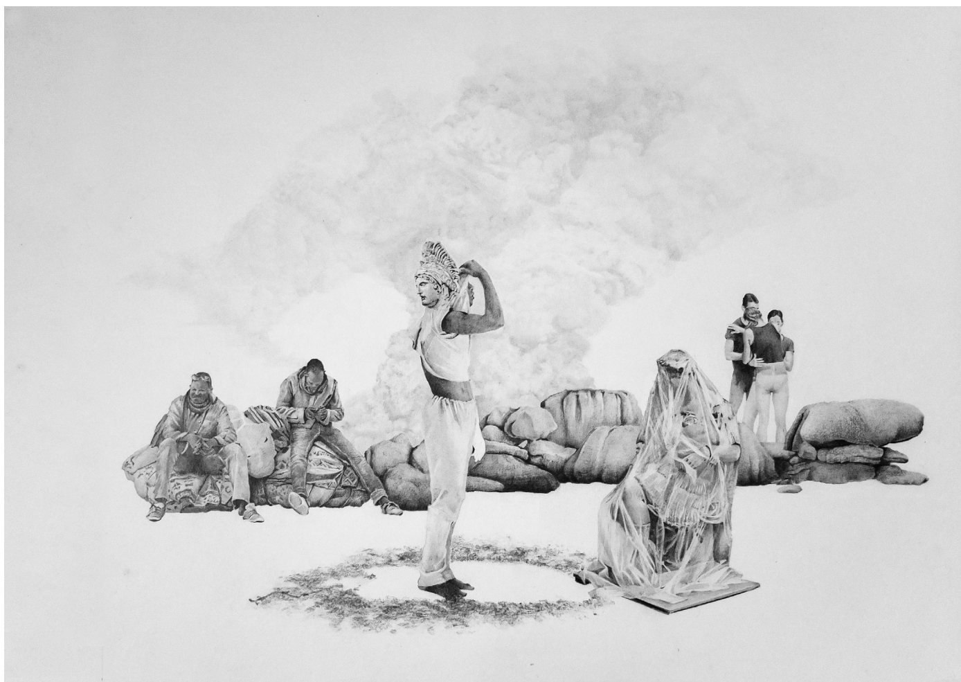
Le voyage , 2022, graphite sur papier, 42 x 53,5 cm

Vernissage le jeudi 4 janvier de 18h à 21h