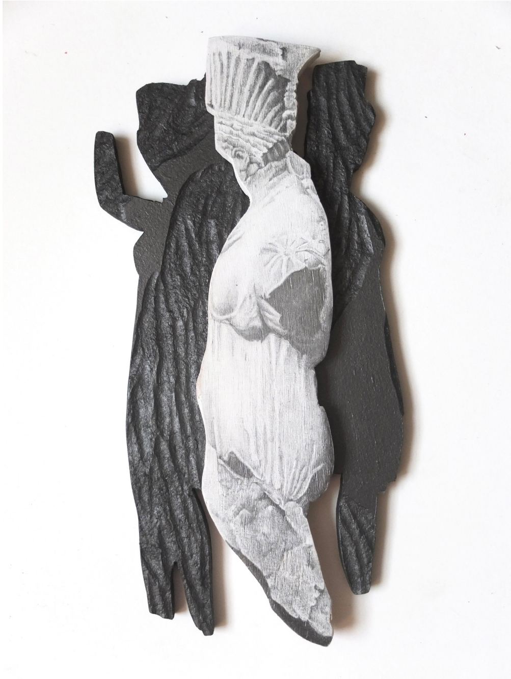
Delphes 1 , 2023, graphite sur contreplaqué MDF gravé et graphité , 27 x 12,5 x 2 cm