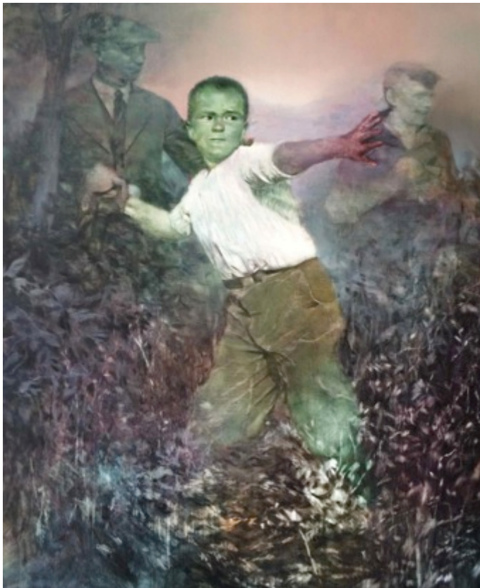
Sans titre, technique mixte, 170 x 129 cm - 2014