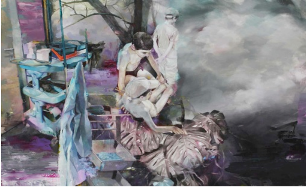
Hôpital, technique mixte, 200 X 300 cm - 2013