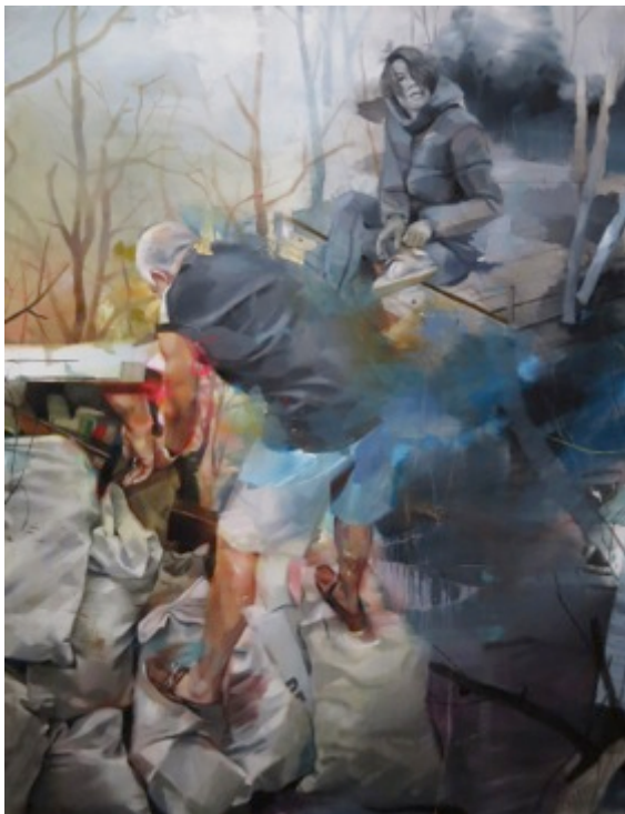
Sans titre, technique mixte, 170 x 129 cm - 2013