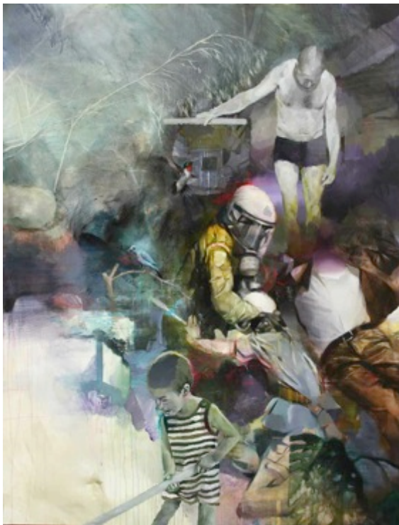
Puppet master, Technique mixte, 195 x 165 cm - 2013