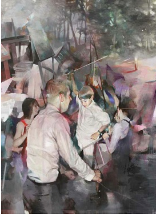
Arthur, technique mixte, 165 x 130 cm - 2013